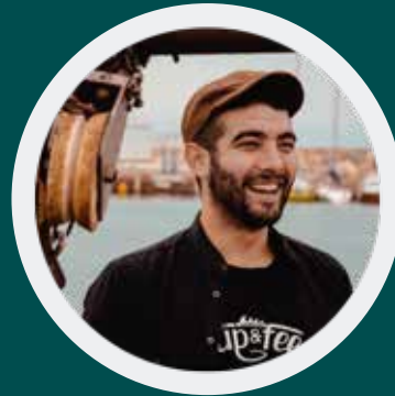
PACO CEO & ADMINISTRATION