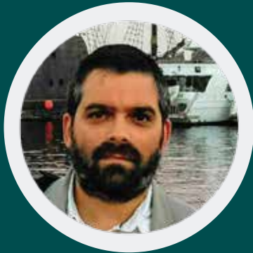
DAVID PROJECT MANAGEMENT