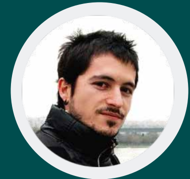
EDU WEB DEVELOPMENT & GRAPHIC DESIGN