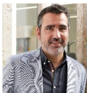
Secretari autonòmic d'Economia Jesús Gual Sanz (des de març de 2024)