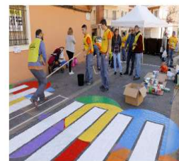
Primeras mejoras en el Vallet

Puçol ya ha puesto en marcha dos actuaciones, dentro del proyecto de mejora del Vallet subvencionado por Europa y la Generalitat Valenciana. Se trata del curso de fotografía y la Escuela de Oficios para Jóvenes.