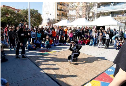
Feria cultural como encuentro de convivencia entre los vecinos de Puçol

Con la finalidad de fomentar la cohesión social del barrio y convertir El Vallet en un referente cultural para la convivencia, se realizaron diversas actuaciones como las ferias culturales y manifestaciones de arte urbano.